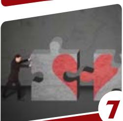
7 יקומה מזרחי מלחיסה למחילה הרבנית

זוהי ההסתכלות הנכונה: אם על פי ההלכה אסור לעבור לפני אדם המתפלל, הרי שיש כאן קיר!