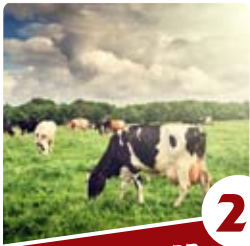
2 הרב דניאל בלס המופת שבדיני השחיטה