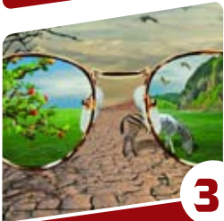
3 הרב יצחק פנגר עניין של הסתכלות