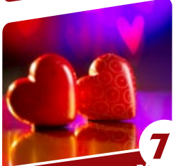
7 הרבנית ימיה מזרחי הסוד של ט"ו באב

מצאנו יסוד גדול זה בשני מקומות. האחד, כאשר התגלה ה' יתברך למשה רבנו בסנה ומשה סירב ללכת בטענה כי הוא ערל שפתיים, הלא יש להבין: מדוע לא ריפאו הקב"ה אלא רק אמר לו "וְאָנֹכִי אֶהְיֶה עִם פִּיךָ וְהוֹרִיתִיךָ אֲשֶׁר תִּדְבַר"? על כך כותב הרמב"ן (שמות ד, י) כי אמנם משה רבנו טען: "אל תצונוי שאלך, כי לא ייתכן לאדון הכול לשלוח שליח ערל שפתיים למלך עמים". אולם "הקב"ה, כיון שלא התפלל בכך, לא רצה לרפאותו!" הרי שאילו היה משה