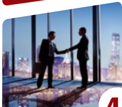
4 הסיפור של ולדר "החקיין"

רבנו מתפלל ומבקש מה' לרפא את דיבורו למען גאולת ישראל - היה נרפא מיד. אך כיוון שלא התפלל על הדבר, נשאר ערל שפתיים. ועוד מצאנו שנאמר בפקידת רחל אמנו ע"ה "וַיִּזְכֹּר אֶל-לְהִים אֶת רַחֵל, וַיִּשְׁמַע אֱלֹהִים אֶל-לְהִים, וַיִּפְתַּח אֶת רַחֲמָהּ" (בראשית ל, כב). וביאר האור החיים הקדוש שם, וזו לשונו: "וַיִּזְכֹּר אֶל-לְהִים, כאומר הכתוב כי הגם שעלה זכרונה לפניו, עוד הוצרכה לתפילה, כאומר וַיִּשְׁמַע אֱלֹהֵי". כלומר, אף שעלה זכרונה של רחל לפני ה' והגיע העת לפוקדה בילדים, בכל זאת רק על ידי שהתפללה וביקשה להיפקד - נפקדה.